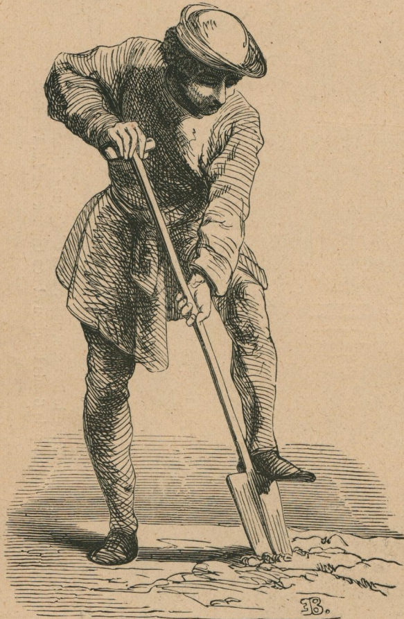
149. — Homme du peuple, serf (1451). Man uit het volk, lijfeigene (1451).