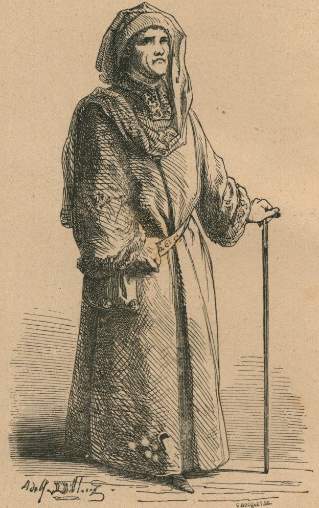
151. — Bourgeois aisé, costume de ville. (Brabant, 1476.) Bemiddelde burger in stadskleedij. (Brabant, 1476.)